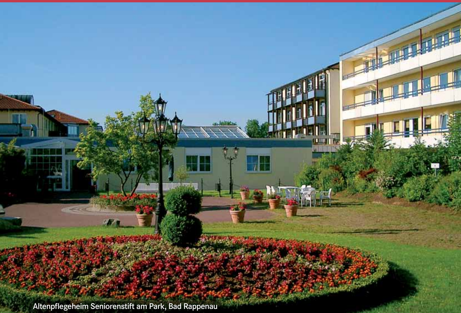
Altenpflegeheim Seniorenstift am Park, Bad Rappenau