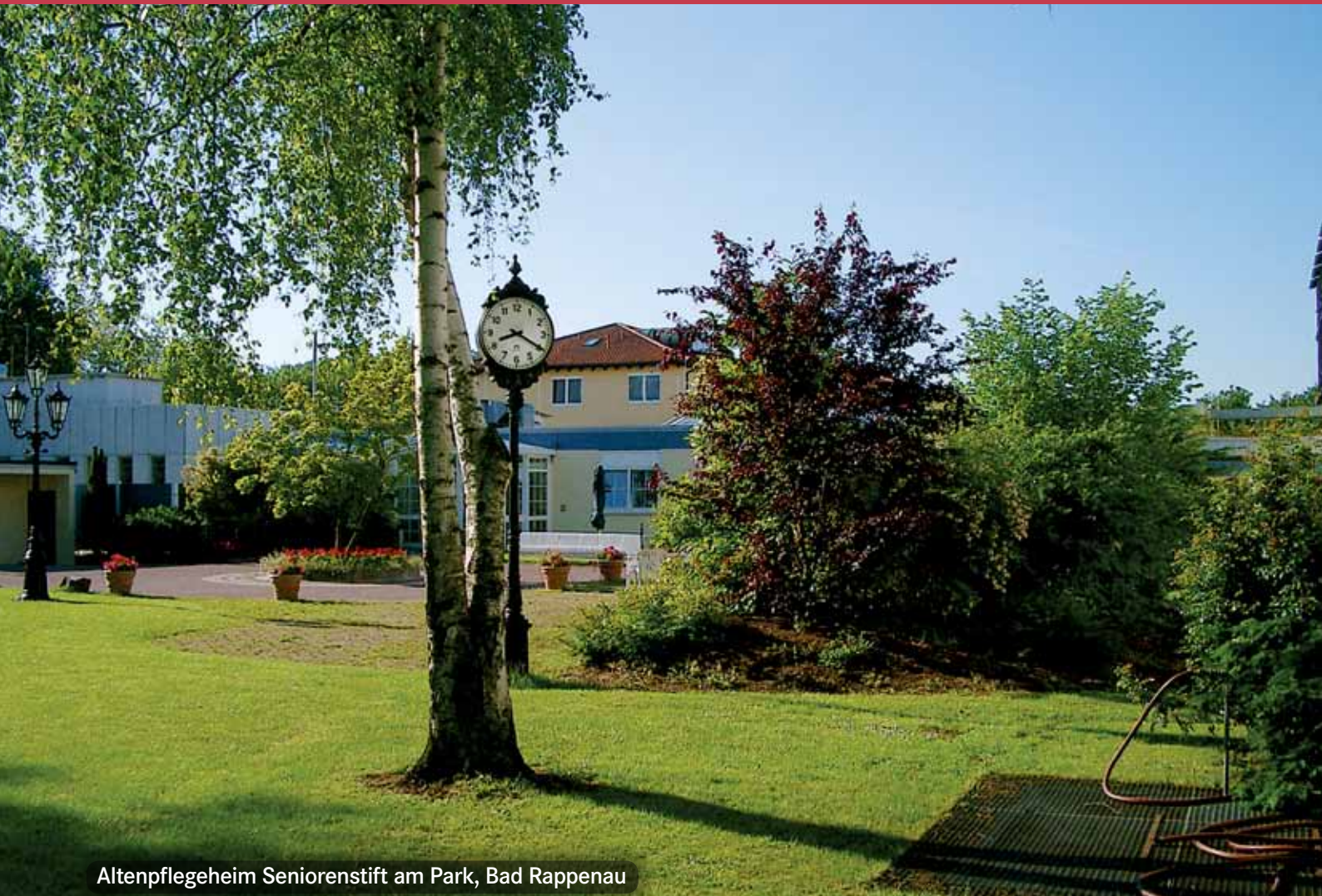
Altenpflegeheim Seniorenstift am Park, Bad Rappenau

Wir wünschen allen unseren Heimbewohnerinnen und Heimbewohnern, ihren Angehörigen, unseren Freunden sowie allen Lesern eine wunderschöne Sommerzeit !